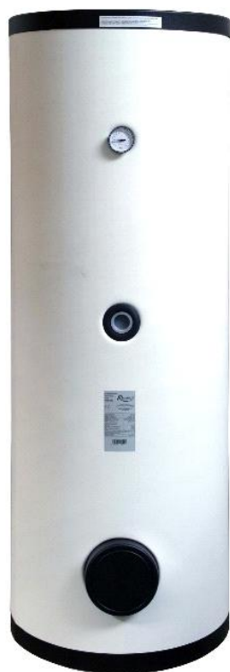
Elektrické topné těleso