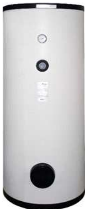
RBC 750 HP