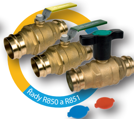
Řady R850 a R851