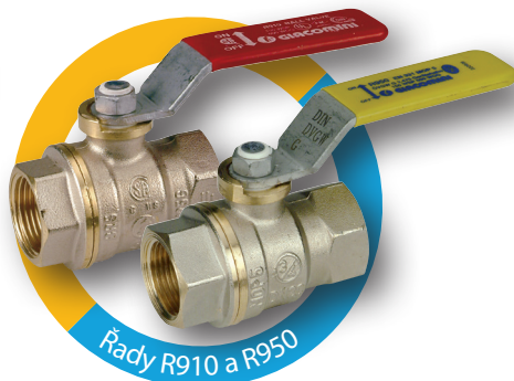
Řady R910 a R950